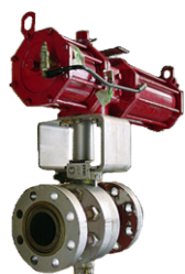
クラス900 プロピレン製造装置 緊急遮断弁