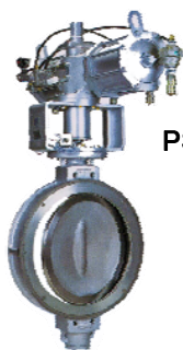
PSA用高速高サイクル ユニフォー