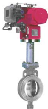
超低温用 エクステンションボンネットタイプ 調節弁 ユニコウ